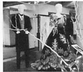
●ウエディング・さわらぎ 京都市上京区丸太町通堀川西入 ジョイフル二条城1F 075・812・1895 10:00AM~7:00PM 水休 駐車場

メイクから本番さながらにシミュレーションして選べるきめ細いもの。コーディネートのアトバイスを受けながら理想の花嫁に。