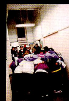
緊張感漂うステージ裏ではメンバーそれぞれが何度も何度もダンスをチェック。「よっしゃー！」と気合いを入れるグループも多数！