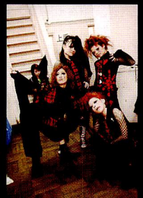
KISSを彷彿とさせるロックテイストのメイクで揃えたKANA NEW SCHOOL JAZZクラス。「ステージではエネルギー大爆発させるぜー！」