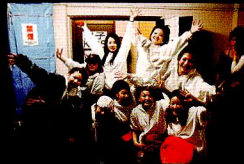
BLACKカルチャーのファッションに身を包んだKO-ICHI HIPHOPクラスのメンバー。チームワークこそダンスの要。「全員で頑張りま〜す！」

東山に鳴り響くHIPHOPの重低音。さらにアフロ、ドレッド、ジャージにTシャツ。古都の概念を打ち破るダンサーのアイデンティティには、観光客や年配をも会場へ引き込む一種の魔力があった。「この場所だからこそ己にプレッシャーをかける」、ダンサー全員の純粋なるダンスへの渴望が、途中から降り出した豪雨も吹き飛ばしたのか。渴望のエネルギーが、世界を変えるのだ。