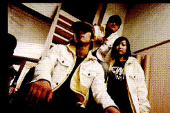
HIPHOP系が多いなか、HOUSEでテクニカルな身体さばきを見せたPE-HOUSEクラスの3人。出番前をバチリ。「チョー緊張してます！」