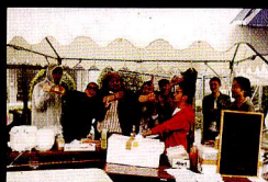
サポート部隊として、UNIONの地元木屋町からは「REDNESTA」「天晴ダイナー」「Bar CRANE」そして「LAB. TRIBE」「あーぐる」が屋台を出店