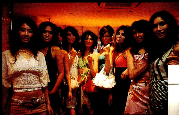
デ일리、パーティ、リゾート、オフィス…と様々なシーン衣装でランウェイを飾った「FOCUS fine models」の有志一同が、ショー後にカメラ前で決めショット

「京都に戻ってくると、人のあったかさを感じるんです。事務所を始めたのも、今日このイベントを開催できたのも、周りの人に引っ張ってもらって、助けてもらえたから。私だけじゃ何もできませんでしたよ」。彼女からはモデルビジネスの先を見据えた強く、賢い女性論が語られるものと思っていた。けれど、実際はこちらをほっとさせるような、意外なほど普通な女の子の言葉。ヴィジュアルや時代が変わっても、慎み深く語りつがれてきた京女の姿は健在なのだ。遠すぎず、身近な距離にいると思わせてくれるのが、やはり「ええ女」の技量なのかも。