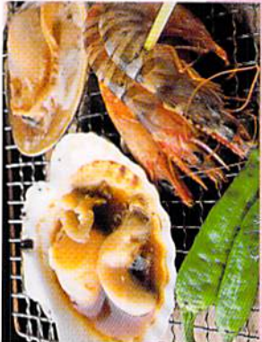
炭火焼き 生山菜をすりおろしついでに、香ばしくまる 年々重なるおかげで、お味はますます、香ばしくまる やかに焼き上げてくれるのが九州産長良。