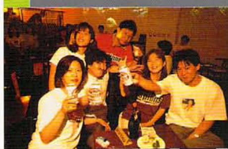
このイベントに協賛のキリンさんご一行、みなさんスリッパで登場もアレという間にTシャツ姿に、「キリンラガーは、右い力を応援しますよ」と天野さんはコケゲン