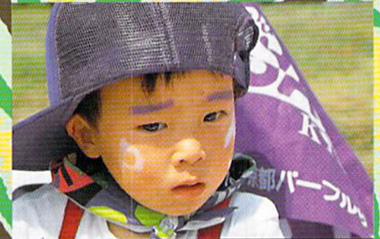
控えめなベインティングが実にかわいい、前出・西京極の桂さん子弟。一家そろって去年の夏からサポーター。おとうさんはボランティアとして、今日も会場のどこかを走り回ってるんだそうです。こんな家族、いいですね。