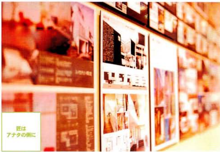
匠は アナタの側に