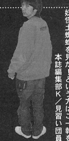
妖怪土蜘蛛を見た! という方は「こ報を本誌編集部K/見習い団員

平安時代、源頼光らが蓮台野で遊山をしていた時、空にどくろが現れ、追跡の末神楽岡にある一軒のあばら家に着く。その家からは続々と魑魅魍魎と巨大な土蜘蛛が現れたのだが、頼光らが無事退治したという土蜘蛛伝説。時の権力者が反逆者を土蜘蛛に見立てて流した英雄伝との見方が強いが、北野にある東向観音寺にはいわずありげな「くも塚」が現存。やはり土蜘蛛は実在したのか?