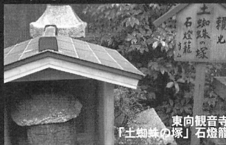
東向観音寺「土蜘蛛の塚」石燈籠