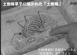
土蜘蛛草子に描かれた「土蜘蛛」