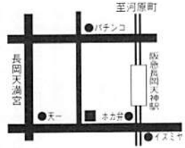
●Tomo & Momo 京都府長岡京市天神1-8-15 ☎075・953・3057 営業10:00AM~7:00PM/木休

「Blue Nile」の店長菅宮明氏は、そのニックネームとは裏腹に「アキ」あくまで冷静沈着に話してくれた。10年間大阪のアパレル業界にいたがデザイン会社を辞めてスタッフとして10年働いて、5年前働き、その後この店を開いたそうだ。ファッション 菅宮さんは、そのニックネームとは裏腹に「アキ」あくまで冷静沈着に話してくれた。10年間大阪のアパレル業界にいたがデザイン会社を辞めてスタッフとして10年働いて、5年前働き、その後この店を開いたそうだ。ファッション