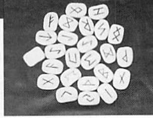
●タロット&ヒーリング森めぐみ 京都市北区等持院中町39-101 inひもろぎ101 ☎075・467・2880 (完全予約制) 鑑定料1時間5,000円

OTHER F 的中率はもちろん、ポジティブなアドバイスも人気。知る人ぞ知る、噂の占いスポット。 恋愛に仕事、対人関係と人生には何かと悩みが付きもの。そこで、今、現在、悩みを抱える人ももちろん、なんと気分が晴れない、てな人も、ぜひ、足を運んでほしいのが、森めぐみ先生の占いスポット。タロットをメインに手相や古くインディアンが用いたといわれるアニマルカード、古代の神託石を使ったルーン占い、さらには名前を書きただけでその人の心理状態や性格までもスバリと言いついてるなど他にはない、様々な角度から運勢を鑑定。当然ながら