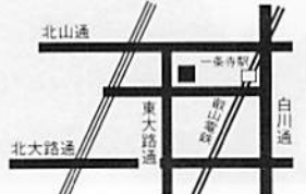
●ジオッコ・チッタ 京都市左京区一乗寺高槻町16 エル・スポーツ京都1F ☎075・702・7701 営業平日1:00PM~2:00AM(金・土・祝前日~3:00AM) 日祝11:00AM~2:00AM/無休

PLAY SPOT F ゲームに思わず熱がはいる！ ジオッコ・チッタのサービスタイム ジオッコ・チッタは、ゲーム、カラオケ、シヨット・バーなどが一同に集まるアミューズメントスペースだ。気の向くまま各コーナーをハシゴして、思いきり楽しむが勝ち。今回はそんな遊びをさらに盛り上げる情報を。ゲームコーナーにバースペースでは、夜9時~11時頃にサービスタイムを実施（前後の時間でも5人までの団体