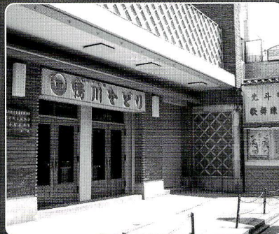
「鴨川をどり」は、5月1日～24日まで1日3回公演。会場は先斗町歌舞練場

司事務所 075・594・0568 http://kyoto.cool.ne.jp/tukasa21