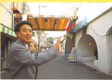
現在は映画館。かつてはダンスホールだった。