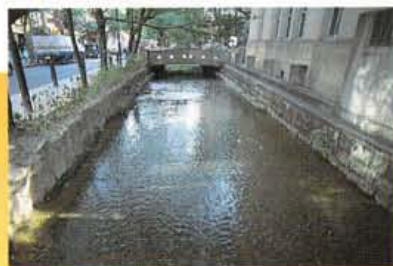
学校の前を流れている高瀬川。