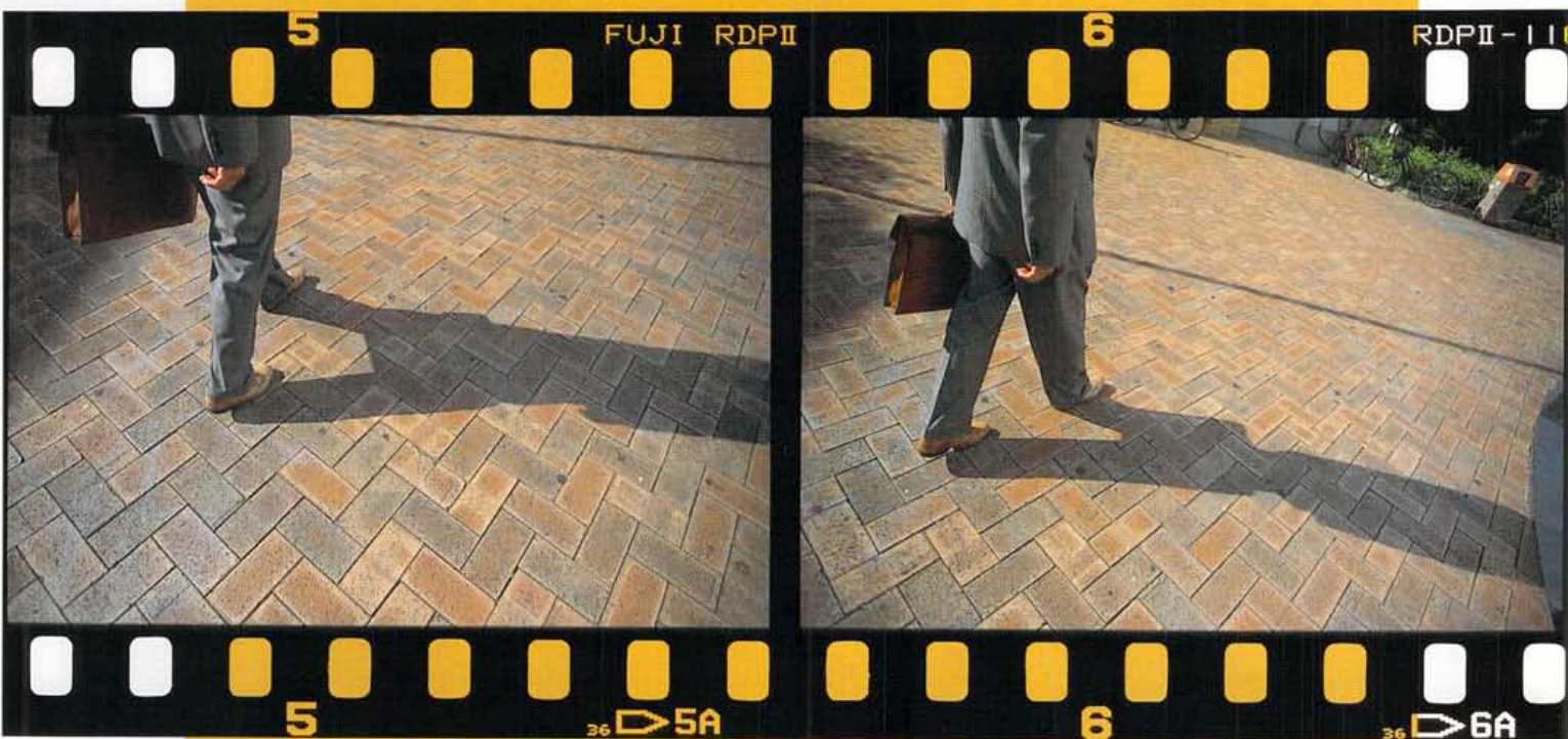
かつて遊んだ公園。これは美松の付近。