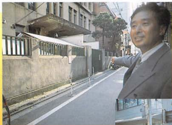
今は廃校となった立派小学校にて。

この花遊小路も木、レコード、楽器、かつら、下駄、呉服、小間物、化粧品、刃物などの商店がこじんまりと並ぶ商店街だったのですよ。祇園の舞妓さんがわざわざ化粧品を買い物にやってくる、ちよつと粋な通りでした。