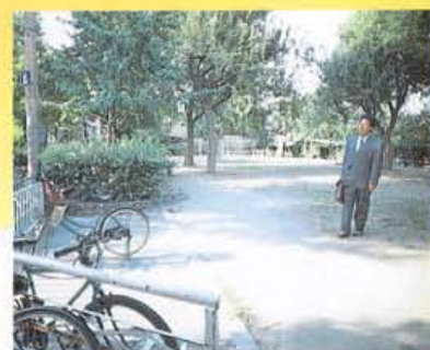
先斗町の公園。ここでフットボールをした。

んでいるのが、はっきりとみえました。 あ、それからね。美松映画館は、 ダンスホールだったのですよ。米軍の兵 士が毎晩遊びにやってくる場所でした。 ものすごく活気がありましたね。アメリ カの兵士は、カッコよかったですねえ。 カーキ色の軍服に白いベルトをキュッと 締めて。そのベルトがちょうど僕たちの 頭のところにあるんですよ。みんな、大 きかったなあ。そんな彼等が地面に膝 をついて僕たちに話しかけてくる。英語 ですから、もちろん意味はよくわかりま せん。けれど独楽まわしを見せてあげた りすると、とても喜んでくれた。そんな ときいつもくれたハーシーのぶあつい板 チョコ。これが楽しかったです。あれは、 ほんとうにおいしかったです。宝物でしたね。 そうしたにぎわいや雑踏の中に、靴 磨きの少年がたくさんいたのも、あの時 代独特の光景だったのでしようね。年 のころは中学生くらいでしょうか。生き ていくことが大変だった人々が、まだた くさんいた時代でしたから：