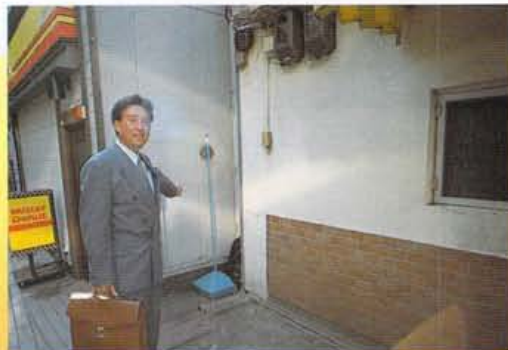
今は無くなってしまった駄菓子屋さんの跡