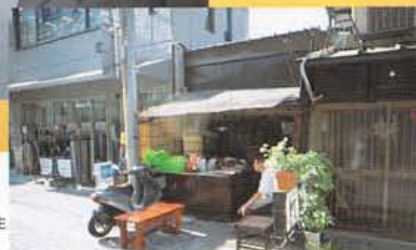
この芋屋さんは、むかしからあった。先代のご主人から、芋のきれっばしをよくもらったそうだ。