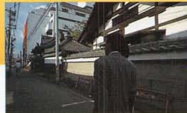
これが、かへの通学路