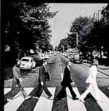
アビィ・ロード THE BEATLES

パーロフォン アップル 2127円(税込) 西野氏が音楽を始めた当初はグループ・サウンズの全盛。「ビートルズを聴くようになったのは、GSの歌点を知りたかったから。中でもこのアルバムはリリースされてすぐ新譜で買って、擦り切れるまで何百回と聴いたね」。