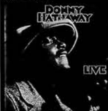
LIVE DONNY HATHAWAY

MCA 2580円(税込) シカゴのリーガル・シアターでのライブの模様を収めた名盤。「17歳くらいだったかな。初めて聴いた時はもう、スピード感とかライブのもって行き方によってびっくりしたわ。僕のギタースタイルに、こっぴつ影響を与えたね」。