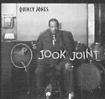
Q's JOOK JOINT/Quincy Jones

avea distribution 2360P (税込) 「この人も好きというか、歌い方がいいというか、パワードが好きなのもあって9曲目の切ないメロディが気に入って、ライブでは必ず歌う一曲。周りの評判もいいので、自分の声に合っているのかな、って」