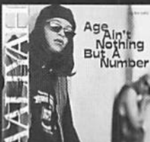
Age Ain't Nothing But A Number AALIYAH

ROBERTA/ROBERTA FLACK ワーナーミュージック・ジャパン 2330P (税込) 「大前千鶴さんに『格好いいやん、ライブでやろー』って勧められて」 言葉のお蔭に入り、ジャズのスタンダードをダンス風にアレンジしたアルバムの中でも「In a sentimental mood」がベスト!