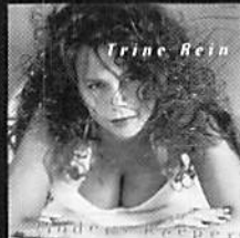
TRINE REIN/TRINE REIN

キングレコード 3000円(税込) 「あまり表舞台にでることなく、5年ほど 前に解散してしまったバンドなんです けど、中学の時にトモダチがすごい ファンで「絶対いいよ!」って、ダイナ ミックで、声に表情がある。上京する 時に1枚だけ持って行ったCD」