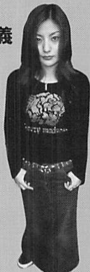
I LOVE 堺

徳間ジャパン 2913円(税込) シングルカットされた「時代」「鳥カゴ」を含む全10曲の1stアルバム。「全て自分で 作詞しますから、1曲ごとに思い入れが強いです。ロック、バラードの他に今まで ないジャンルも開拓できて、大満足の仕上がりに」