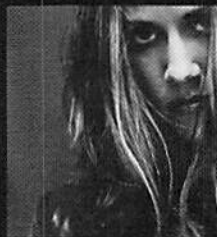
SHERYL CROW/SHERYL CROW

東芝EMI 1699円(税込) 「今まで一人のアーティストにのめり込 まなかったけど、彼女は別 シフトしたかと思ったら、色っぽくさ やくよく歌ってました。表現がすべ い。邦楽ノルウェーでは20人に一人が 持つというメガヒットアルバム」