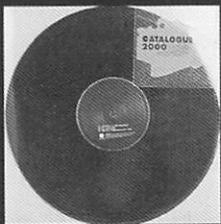
CATALOG 2000 / CATALOG LABEL

輸入盤 イギリス人2人組のHIPHOPなんです けど、フォークっぽい要素もあってガチガ チHIPHOPじゃない。レコーディング中、 よく聞きました。プロデューサーはビ ンステイ・ホーイズのマリオ・カルター ド。イ仕事してます