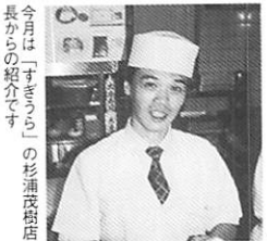
今月は「すきょう」の杉浦夜店 長からの紹介です