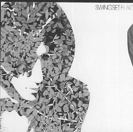
FLAG / SWINGSET

BANBINI / 2300円 (税抜) バンビ二初の日本人アーティスト「SWINGSET」の待望のデビューアルバ ム。です (笑)。6曲目以外は全て新曲書き下ろし。全体の根底に流れるもの を敢えて言えば、メランコリックにハマリすぎないフォークかな