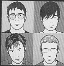
the best of / blur

Music is moistened our life. Tasteful album is here. We'd like to find your recommended one.