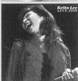
ケイコ・リー・ライブ 1999/ケイコ・リー

sme records 2730円(税込) かつてピアノを弾いていたという異色の経歴をもつ彼女は、今や女性ジャズヴォーカリストとして、飛ぶ鳥を落とす勢いで、これは彼女が初めて出したライブバージョンですが、これほど臨場感に溢れた完成度の高いライブものはまず珍らしい。