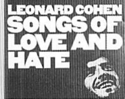
SONGS OF LOVE AND HATE LEONARD COHEN

輸入盤 ボブ・マーリーが在籍していたザ・ウェイラーズの傑作レゲエアルバム。ラストファリアンである彼は、神との逢り合いを精神的に表現してきた本物のアーティスト。彼の歌の90%はインスピレーションだと思えるよ。