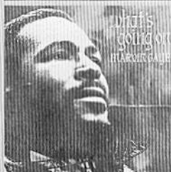
what's going on / MARVIN GAYE

輸入盤 インスピレーションに溢れたアーティスト。躍い人生を歩んできた彼が、初めて宗教から社会意識に目覚めた詞を放ったアルバムがコレ。彼のソウルを聴くと、「天国の声」とはこんなふうだろうな、と感じるよ。