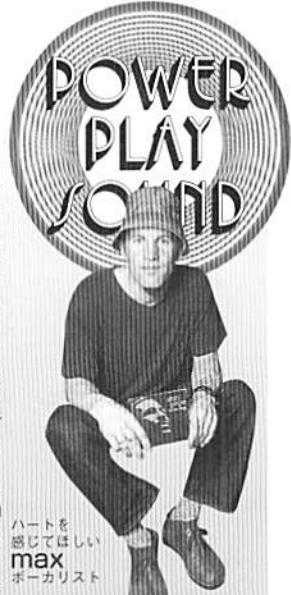
ハートを感ぜてほしい max ポーカリスト

singular sky elements SINGULAR SKY ELEMENTS 2625円(税込)