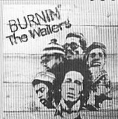
BURNIN' / The Wailers

輸入盤 インスピレーションに溢れたアーティスト。躍い人生を歩んできた彼が、初めて宗教から社会意識に目覚めた詞を放ったアルバムがコレ。彼のソウルを聴くと、「天国の声」とはこんなふうだろうな、と感じるよ。