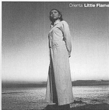
Orienta Little Flame

期待の2ndアルバム。メロディー作りからの参加で、より私らしさを盛り込んだ心作! 何気なく毎日聞ける柔らかい音ながら、全12曲ひとつひとつに個性があって聞き飽きない一枚に仕上がってるよ。