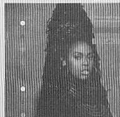
UK BLACK /CARON WHEELER

輸入盤 聴いてて気持ち良くなるリラクゼーションサウンド。そこに興の力が程よく抜けた歌いまわしや、空気感のある声があびったり合ってる、ホントに聴きながら心癒されるんです。朝爽やかに聴きたい人にもおすすめ。