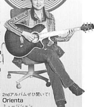
Little Flame / Orienta 2ndアルバムぜひ聞いて! Orienta ミュージシャン