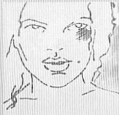
blame it on me /alana davis

輸入盤 聴いてて気持ち良くなるリラクゼーションサウンド。そこに興の力が程よく抜けた歌いまわしや、空気感のある声があびったり合ってる、ホントに聴きながら心癒されるんです。朝爽やかに聴きたい人にもおすすめ。