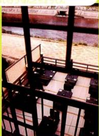
精川納涼床は9月末まで

「お造り3種盛り」1890円、「三色生鮎と烏子の揚げだし」780円、「水菜とおあげのサラダ」850円。店長は系列のバー「キス・ラボッカ」出身ゆえ、和酒だけでなくカクテルもお任せあれ