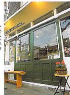
北白川のプリンツカフェに勤めていた女性二人でオープン。ケーキや焼き菓子などテイクアウトも可 メインにホットサンドかキッシュを遊ぶデザートプレート700円は、スープとサラダ、シフォンケーキ付き。美山町の手煎豆コーヒー400円