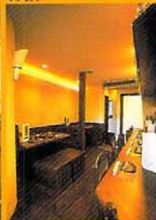
小ぶりの店内も占拠する約150種の焼酎。メニューに載らない物がほとんどなので、好みの味を店主と探るのが良い