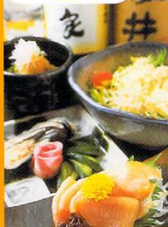
京水菜とじゃこのハリハリサラダ789円 ポシから699円。おばあちゃんのなつかしどば漬530円。薩摩地鶏刺し699円