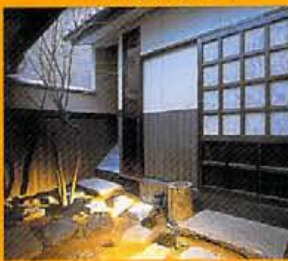
露地の裏には「湯川書院」。そして主人の交友関係から青果店主や文楽家なども集まるここは、大人の酒を学ぶにも上質なサロンかも

■京都市中京区河原町 三条上ル二筋目東入ル ☎075-211-1982 ●18:00~不定/無休 【平均予算】3000円