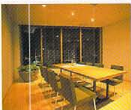
体感してみないと解らない。空間を包み込むようなBGMは音響デザイナーによる仕掛け。個室のみチャージ5000円

駅近にそびえ立つビルの屋上12F、テラスにジャグジー、そして彼方には琵琶湖を望む絶景…。そんな天空の理想郷ならぬカフェは確かに実在した。が、街カフェ文化の根付いてないこのエリア。エッジを効かせた造りじゃ「敷居が高くて敬遠されそう」と。内装は客との歩調を合わせるため意図的にキメすぎない造りに。ならば街と呼吸しつつ満了する日をじっくり待とうではないか。