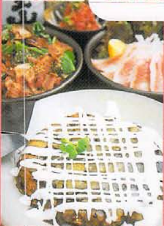
どんべ焼き850円、ほうれん草サラダ480円、チャンシヤ300円、キムチ盛り合わせ500円、トントロ480円