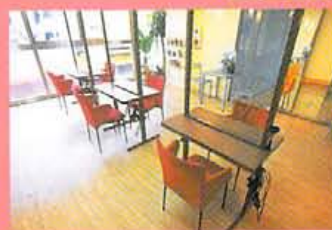
フローリングとグリーンと床タタミ。α波大放射の最高の空間設計。猫のように想わずまどろんでみたくなる