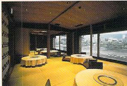
元は10年間平付かずの料理旅館。cafe co デザインの店内は、テーブルの幅を広く取るなど、余白優先。2Fには2名から利用できる個室や「大人には会話が付きもたせよう」と大広間を用意