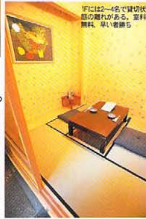
1Fには2~4名で貸切状態の隠れがある。資料無料、早い者勝ち

おでん、惣菜、魚、そして、シンプルな洋食。奇をてらうより手間をかけた一品揃い。特製クリームコロッケ680円、ピーフシュー680円、生麺と生湯葉の吉野煮あんが1650円