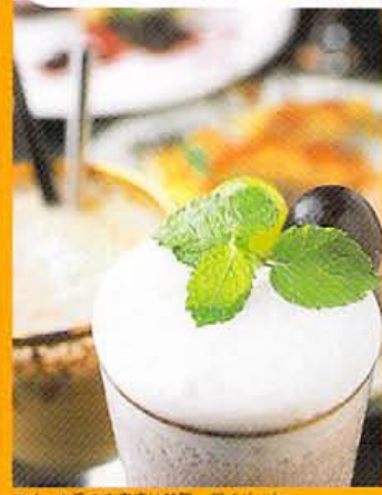
スイーツ系の充実度は特筆。デリーケー キプレート900円～、日曜のクラスデザート 700円、フィンガーフードの協会せ800円～、 キャラメルカフェ700円