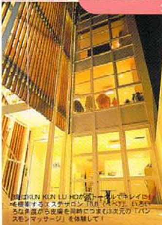
旧堀はKUN KUN LU HOが通一階ビルでキレイにリノベーションするエステサロン「BB (ビビ)」。15坪の広さから夜間を同時につまむ3次元の「パンスモンマッサージ」を体験して!