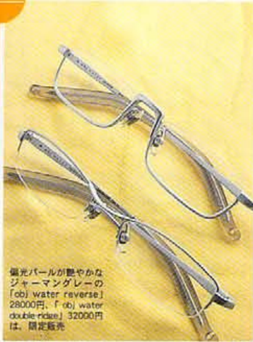
偏光パールが艶やかな ジャーマングレーの 「obj water reverse」 28000円・「obj water double ridge」32000円 は、限定販売