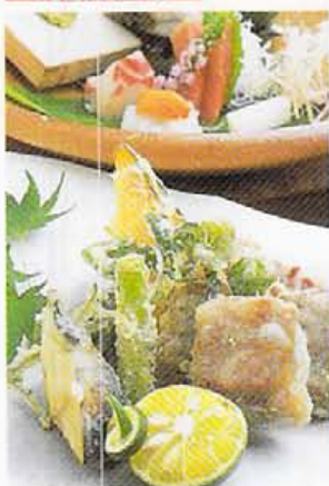
牛肉天ぷら2000円 (一人前) ~。漁り盛り合わせ1200円 (一人前) ~

■京都市中京区河原町 三条下ル二筋目東入ル北側 CTビル1F ☎075-212-7170 ●17:00~23:00 / 不定休 【平均予算】6000円