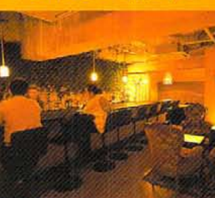
空間デザインは、東京のスタイ リスト集団TOOLSに依頼

北山に、このバーあり…と謳われ たSTSが6年の歳月を経て、大変革。 バーでもなく、クラブでもないラウ ンジスタイルを提唱し、まったくと 置の時間を供してくれる。シャン デリアが妖しく輝くモダンゴシックの 空間には、ピンヒールの美女がお似 合いのようで。