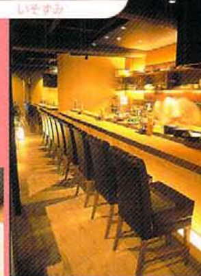
1階のカップルシートや合コンルームでラブライブ!

おでんやら串焼きやら、一般大衆が喜びそ〜な献立が、財布まで喜びそ〜な金額で食べるとしたら、あそこしかない。そう、赤ちょうちん! おやじの果敢たる赤ちょうちんを、デパート帰りのマドモアゼルが寄りかかろう店に発想転換。アカ抜けた空間にグッときますよ。