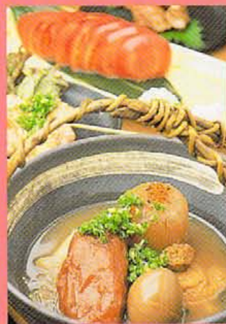
串焼きの豚タン300円。ごま味噌味噌の豚バラ350円。店主の実家・五十樓農園の冷やしトマト400円。夏だしに豚骨スープが隠し味のおでんは盛り合わせ600円