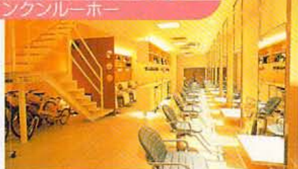
クンクンルーホーは中国語で「太古より文明や文化は常に河のあるところから栄える」の意味。目指すは河のような存在であるサロン