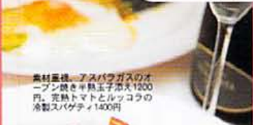
素材重視。アスパラガスのオープン焼き半熟玉子添え1200円。完熟トマトとルッコラの冷製スパゲティ1400円