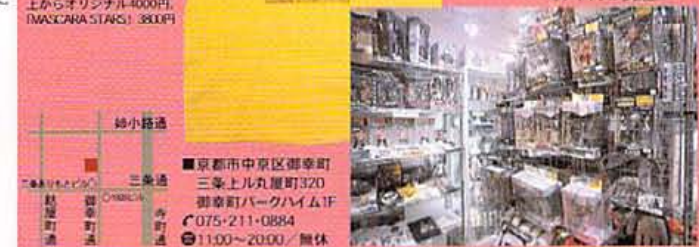
Tシャツの他、漫画ライダニ、ガンダム、AKIRAなどのフィギュアが多数並ぶ

■京都市中京区御幸町 三条上ル丸屋町320 御幸町パークハイム1F ☎075-211-0884 ●11:00~20:00 / 無休