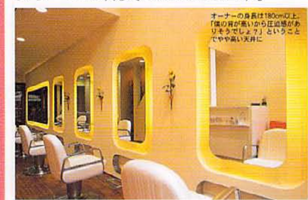
オーナーの身長は180cm以上、「僕の背が高いから圧迫感がありそうでしょう」ということでやや高い天井に

■京都市中京区寺町 髪師西入ル南側 ☎075-253-6611 (予約優先制) ●10:00~20:00 (パーマ・カラー受付~18:30、カット受付~19:30) 土10:00~19:00 (パーマ・カラー受付~17:30、カット受付~18:30) 日祝9:00~18:00 (パーマカラー受付~16:30、カット受付~17:30) 月、第2・3火休 【メニュー】 カット5000円~ パーマ3000円~ カラー5000円~