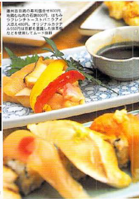
薄州百日鶏の寿司盛合せ800円。地鶏むね肉の石焼800円。ほちみつフレンチトーストパニラアイス添え480円。オリジナルカクテル550円は京都を基調した抹茶系などを使用してムード抜群

■京都市中京区河原町 四条上ル2丁目下大阪町350 ☎075-212-1332 ●17:00~24:00 (L.O.23:30) / 無休 【平均予算】3000円