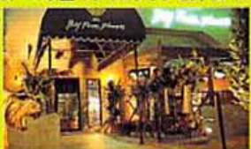
真の Couples ベンチでは、夏の夜に埋め込ん だテレビを見ながらラブ〜い食事タイム

メガドームドッセ隣に、パリエーの緑豊かなカフェレストランが参上。 南国系スタイリッシュ空間で味わうのは、20以上のラインナップを誇るメガ サイズ・オムライスを始め、200に及ぶ リーズナブルな創作料理。深夜2時まで 使えるカフェも涙もんの有難さだ。