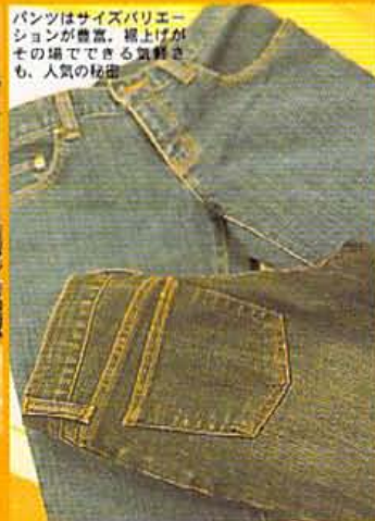
パンツはサイズバリエーションが豊富、裾上げがその場でできる気持さもあり、人気の絞布

■京都市南区東九条西山王町31 アバンティ2F ☎075-694-5582 ●10:00~20:00 http://www.uniqlo.co.jp/