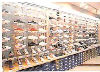
ケース付きのNIKE AIR JORDAN XVI (25000円)、スニーカー風のパターンが特徴のAdidas METROATIT (13000円)