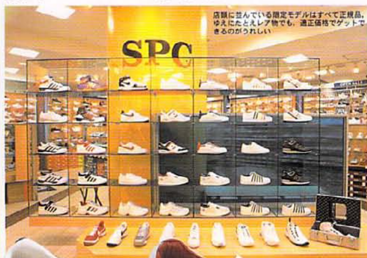
店頭には並んでいる限定モデルはすべて正規品、ゆえにたとえレア物でも、適正価格でゲットできるのがうれしい