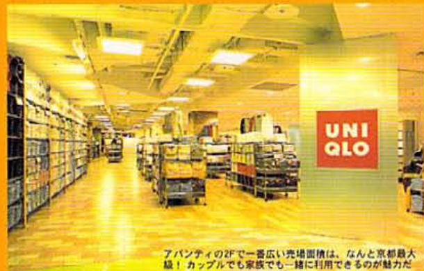
アバンティの2Fで一香広い売場面積は、なんと京最大級! カップルでも家族でも一緒に利用できるのが魅力だ

■京都市南区東九条西山王町31 アバンティ2F ☎075-671-8945 ●10:00~20:00 http://www.chiyodagrn.co.jp