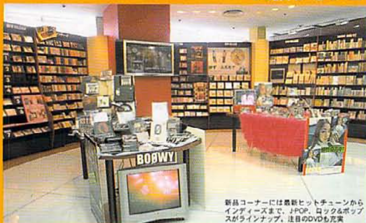
新品コーナーには最新ヒットチューンからインディーズまで、JPOP、ロック&ポップスがラインナップ、注目のDVDも充実