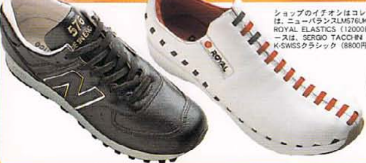
ショップのイチオシはコレ! メンズは、ニューバランスLM576UK (22000円)、ROYAL ELASTICS (12000円)、レディースは、SERGIO TACCHINI (11000円)、K-SWISSクラシック (8800円)