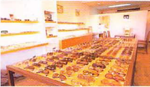
上から2本がcompetition R (33000円)、下2本がobj water 8 special (28000円)。フレームカラーは4色展開。今季のもう一つの目玉はメラニンレンズ。UVはもちろん、可視光線中の有害光線からもバッチリ保護。カーブのあるフレームに搭載可

皆さんお待ちかね。オブジェ新作発表のシーズンが到来。今季はまず、ウルトラロングランシリーズ・obj waterに、レンズのサイズアップでさらに視界良好の「competition R」が参画。ナニゲに進化し続ける姿勢は、まさにショップのカガミ。そしてオブジェと言えばその機能性。目によくない光線をバシッとカットしてくれるメラニンレンズ、軽くて強いフルチタニウムフレーム、弾力性・耐久性に優れたゴムメタルのネジ、スプリングアームや左右傾斜角の微差によりどんな顔型も包み込みがけ心地は、「やっぱりさすが」。