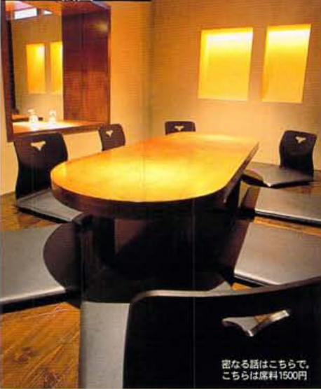
密なる話はこちらで、 こちらは席料1500円

フレッシュグレープフルーツを使った、ガルフストリ ーム1000円。シャトー・ラトゥール・ブランシュはグ ラス1300円、ボトル6000円。ワインはボトル5000円〜 チャージ1000円