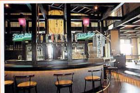
掘り炬燵のテーブル席。一本の原木から造ったちゃぶ台(というには立派すぎ!)の座敷を併せて70席の大バコ