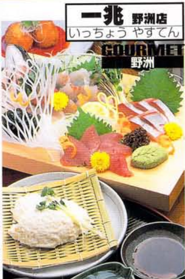
だし醤油・だしあん・ポン酢の3種のつけダレでいただく、ざる豆腐450円も自家製。3選のお盛り盛り合わせ1800円、海老クリームコロッケ520円