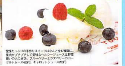
愛情たっぷりの手作りスイーツはなんと全17種類に。果物がプンプンして美味なヘルシージュースは野菜のみにせむ。ブルーベリーとラズベリーのヨーグルトムース480円、キャロットジュース700円