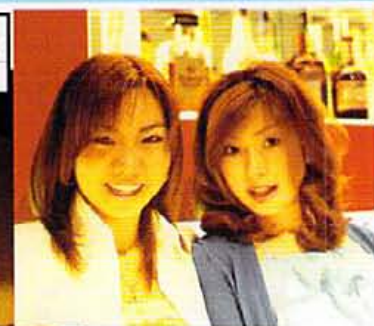
今宵は鹿野子さんと高さんがエントランス「写真、大好き!」というところでニコヤホウに入ったもの、ショット000円