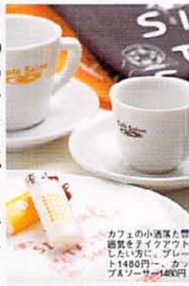
カフェの小洒落た装飾をテイクアウトしたい方に、ブレンド1480円、カップ&ソーサー1480円