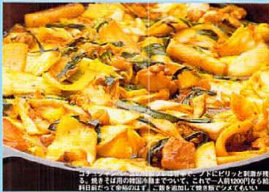
コリアン料理の定番である、辛味とピリッとしたソースが特徴。焼きそば用の韓国冷麺までついて、これで一人前1200円なら給料日前だって余裕のはず。ご飯を追加して焼き飯でシメてもいい!