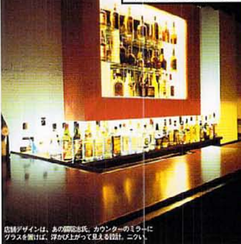
店舗デザインは、あの藤原美氏。カウンターのミラーにグラスを照らせば、浮かび上がって見える設計。ニクイ