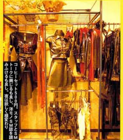
コーヒルセット500円、スタッフとSM トークに楽しめるも良し、洋モノSM誌を みふくも良し、夜は味よく接客受け

併設ショップでは25000円前後のコルセットがお薦め。なんとデザインから縫製まで女王様の手作り