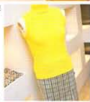
ヘンプ素材のノースリニット1500円はイエロ一色で透視。ガータ一層が身体にフィットしてラインを強調。スカート13800円はキュッと上がったお尻を演出