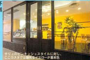
サリュのピンクッシュスタイルに對し、ここコスタでは暖かいイエローが基本色

■京都市中京区三条通河原町東入ル中島町74 ☎075-212-5666 ●11:30~24:00/無休 平均予算900円