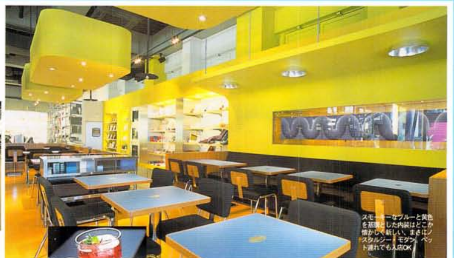
スモークブルーと黄色を基調とした内装はどこか懐かしも新しい、まさにノスタルジック・モダン、ベント通れても入店OK

雑居ビルの一室から辺境の郊外までカフェが溢れるご時世、いわゆる「カフェブーム」の火元をたどれば、東京の「パワリーキッチン」、「ロータス」にぶち当たる。新風館1階の「GEORGE'S」にオープンしたこのカフェは、未だリスペクトされるそれら2軒の生みの親・山本宇一氏の手によるもの。ちゃんとした食事ができる一昔前の「食堂」がイメージであり、高感度な雑貨はもちろん、世界の音楽や熱いアートと出会う「ライフスタイルストア」である。またもやカフェの新潮流…なんて書くのはむしろヤボってもの。