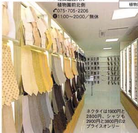
ネクタイは1900円と2800円、シャツも2900円と3800円の2プライスオンリー