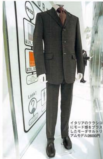
イタリアのクラシコにモード感をプラスしたモーダサルトリアムモデル28000円