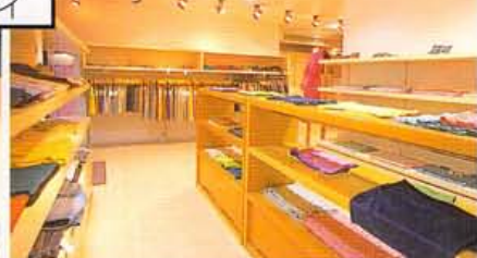
HPではいち早い新作情報や通信販売をお届け