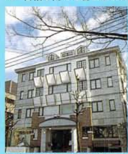
タッチパネルで希望ドレスを検索、待たずして試着できるシステムも完備。事前に来店予約のこと