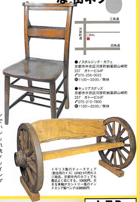
イギリス製のチャーチチェア(教会用のイス)はNO.1の売れっ子商品。京都市内のカフェでも最近よく目にする。10000円。大きな車輪がカントリー風のインドネシア製ベンチは88000円

●キュリアスグッズ 京都市中京区河原町蛸薬師山崎町 257 ガトービル3F ☎075-213-7800 ●11:00~20:00/無休