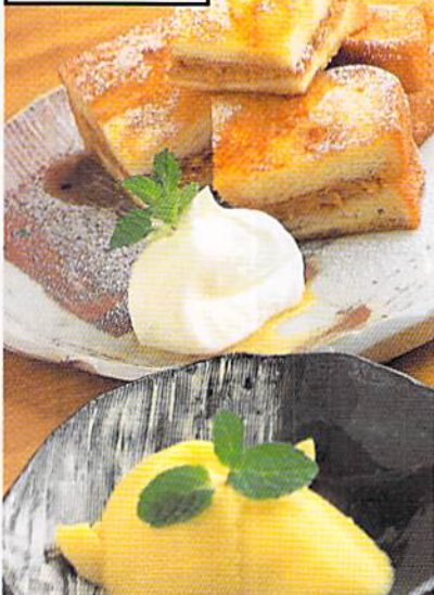
外側カリッのフレンチトースト500円はピーナッツバターをサンド。手前は自家製のマンゴプリン400円

タイ風の味付けにバジルの香りをプラスしたピリ辛 こはA.900円はドリンク付でランチに登場。プラス 100円でデザート付に