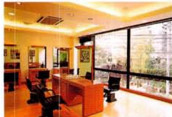
ガラス張りの店内は明るく広く和める。春には高瀬川沿いの桜が目に見え込んでくる...

階段を上がってくると、すぐ横手にがらんご二条苑の優雅な風景を望む贅沢なロケーション