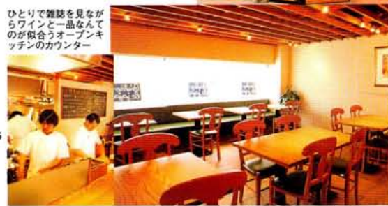
南仏風の店内はカフェのように気取らぬムード。料理もみんなでワイワイシェアして

■京都市北区上茂高純手町75 クルーゼ神山1F ☎075-722-8891 ●11:30～14:00 17:30～21:30/水休 平均予算3500円