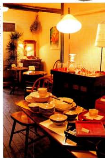
和陶器は小皿で500円前後～と買いやすい。カフェは珈琲350円、ケーキセット600円

ながらの商店街の一角にあるカフェを併設した雑貨屋さん。雑貨は信楽焼きや京焼きなどの和食器がメイン。作家物ながら価格はかなりおさえて、風格漂いつつ普段使いにもぴったり使えるヤツ。物色ついでに奥のカフェで手作りのケーキやクッキーでお茶もOK。