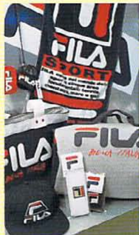
バックは左¥7800、右¥7600。リストバンドなどの小物も揃う。