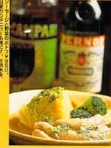
ソセシと野菜のポトフ ¥980、日曜メニューも充実、8時営業。