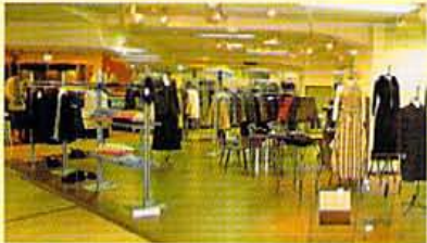
斬新な発想で作られたジャケットやパンツ、MATERIALSのアイテム