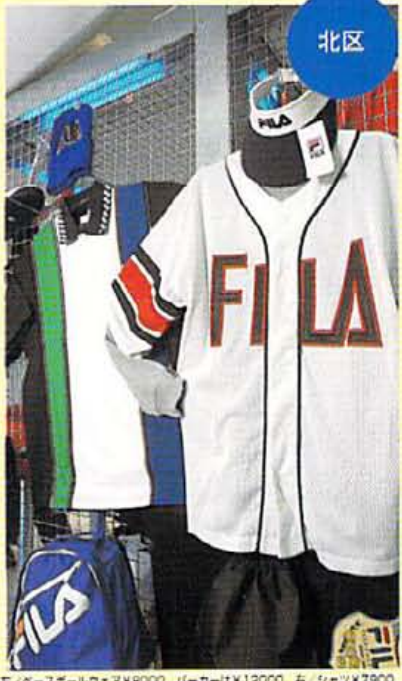
E/ベースボールウェア¥8000、パーカーは¥12000、右/シャツ¥7900。