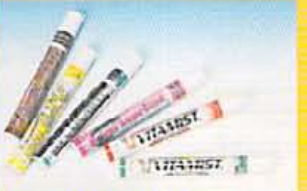
ずらりと並んだビタミスト各種¥4100〜