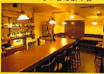
「開店以来、口コミでお客様が集まってきた」と店長。

屋町の超深夜に、コメドールなメシを食べられる場所がある。スペイン語で「食堂」というこの店、ありがちな欧州料理屋にはとてつもない。「ただ普通の料理だと、喜んでもらえないから」という店長の言葉のとおり、わざわざ集める前のチヨリンをトマトソースにからめたソースや、チーズを丹念にのぼしたバジルソースを作ったり、一ひねり、二ひねりした料理が食べられる。 ●京都府中京区河原町三條上1-1 新自車入ル TEL: 075-211-1000 ●6:00～24:00 / 無休