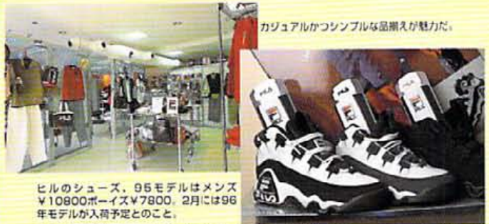
カジュアルかつシンプルな足入れが魅力だ。ヒルのシューズ、95モデルはメンズ¥10800、レディース¥7800。2月には96年モデルが入荷予定とのこと。

FILA ショップ キタヤマ シツクでシンプル。フィラの ストリート&スポーツウェア。