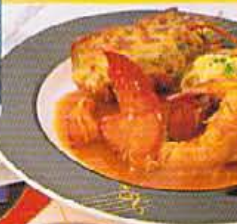
サラダ、オマールのアメリカンコース。コースの一品から。