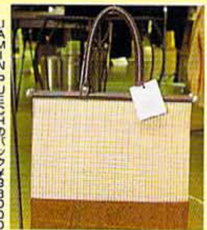
JAMIN PUECH のバンク ¥38000