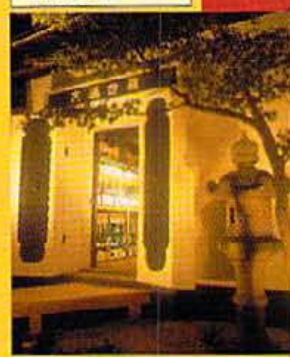
古蔵に流れる時の香り

「町衆の花町」として伝統と格式漂った祇園に、あの「豆水樓」が登場。国内産大豆を天然水で仕込んだ自慢の自家製豆腐、その豊富な旨味を京料理の技に託して、四季折々の素材とともに食べる。また、京の町衆ならではの土蔵も用意。豆腐料理と良くあう日本酒を、全国各地の蔵元から50種類選りすぐって集めている。近くには「高台寺」をはじめとする名所旧跡が多数あり、観光帰りに気軽に立ち寄りつてみては。おすすめは「おまかせコース料理」で、精進膳（日・祝の午後2時まで）、南禅。季節ものの料理が楽しめる。「豆腐グルメのお食事会」¥5000も見逃さない。 ●京都府東山区大宮原上1-1-1 豆水樓 木屋町店 TEL: 075-341-0000 ●平日11:00～21:00、土日祝10:00～21:00 精進膳（お食事会）/月休