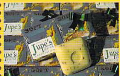
今なら話題の海藻石けんが当たるスピードくじも実施中。

ボカホソタスのセーター ¥29000、京都での両シリーズ商品の取り扱いはここだけ。