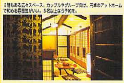
2階もある広々スペース。カップルやグループ向け。円卓のアットホーム で和める雰囲気がいっぱい。5名以上なら予約を。

こじんまりとした店内だが、作り手の作品 である商品が並び、中野氏自身のデ ザインでもある「セックスレス」は店自体 のテーマでもある。