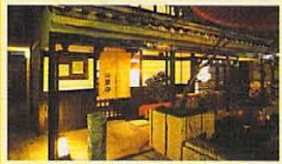
手頃きの豪華な赤いライトが目印。明治時代にタイムスリップしたような ぎをん楽宴小路。気まぐれに選べる個室が楽しめることも。

FASHION GOODS GOURMET SPACE SHOP NIGHT SPOT