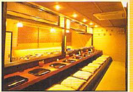
カウンターに並べられたおばんざいの器は伊万里などの高級品で、 さりげなく使われているのがニクイ。

明治時代のあやつり人形など アンティークがあしらわれた 空間で、どっさりいしえの ロマンに浸って一杯。