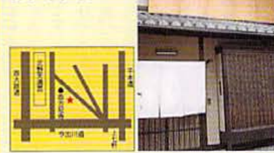
和にかかわらず幅広いジャンルの料理で楽しませる板前が居るのも魅力。その日の仕入れによるお造りも味わえる。さくら風巻コースは¥1,300、辛口の絶品、真澄(山月)は¥1,900。