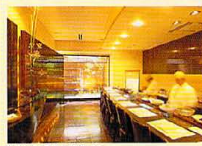
カウンターのみの店内。漆塗り調の落ち着いた色調をメインとしモダンな京情緒が集約された格調のある造り。ノーチャージ。

並べられた鉢ものは月替わりで¥400〜。着や盛り付けの趣向にも京情緒が感じられる。