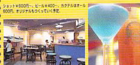
ショット¥600円〜、ビール¥400〜、カクテルはオール600円、オリジナルもつくっていく手定。

本 場イタリヤそのまの エスプレッソコーヒーが味わえる。と人気あるエル・ドラド北山店がリニューアル。新しい味、新しい空気、新しい人。新しい味、新しい空気、新しい人。新しい味、新しい空気、新しい人。 ●京都市左京区下鴨町北山町 ●075-770-2866 ●9:00～1:00 / 日祝休