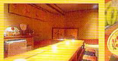
モダンな中にも京都らしさが残る店内。足湯と試飲できるお茶も。個室になった茶室もあり。