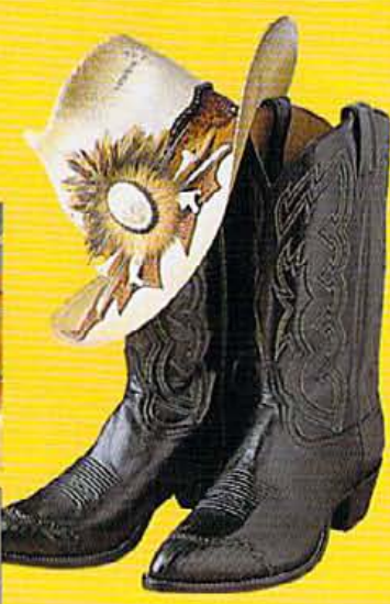
皮の種類とステッチで値段が決まるというウエスタン・ブーツ ¥49,000。ウエスタン・ハット ¥49,800。