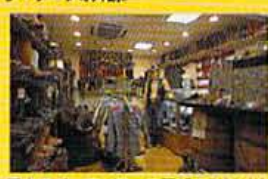
巨大なバッファローの頭部の割製が迫力の2F。

ウ エスタンのボウ、五軒目のショップは、イタリアのウエスタンをメインとするセレクトショップとスペースをシェアしたスタイル。1Fはオーダーメイドも扱うセレクトショップ、サータス5.3をメインに、2Fはボウをメインに展開している。オーナー同士がたまに「知合いやめたから一落ち着いたスタイルというが、店内は割製の間こうにスリットのサンダルが並ぶという味のある趣向。こちらのボウは、ウエスタン・ハットとブーツをメインに揃えられていて、特にブーツはユースドを含め充実。バックルも豊富に揃ってはおすすり。 ■京都市上京区千本通中五軒上北角 075・462・9867 11:00-18:30/無休