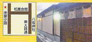
お茶屋的でちょっと敷居が高く感じるが、料金は良心的設定。女性同志ならセット料金も半額になる。