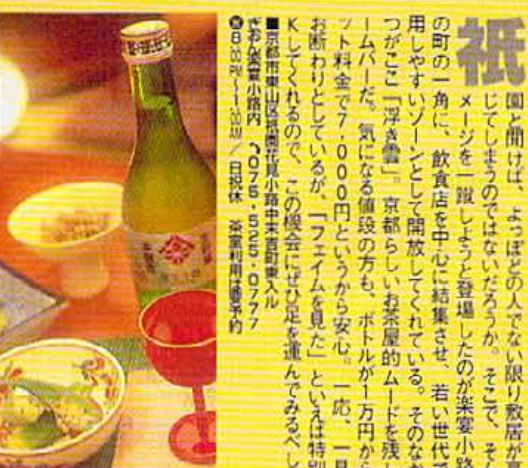
乾きものが多いこの手の店だが、コチラは写真のようなちょとしたおつまみも用意。