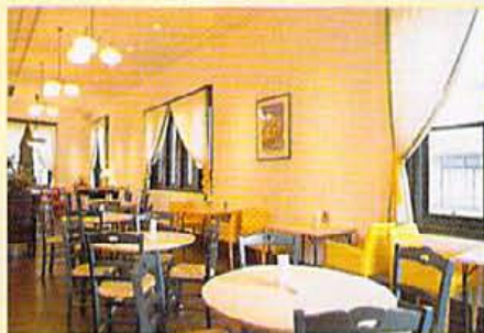
高天井にオリジナルの照明。ゆ ったりとした店内に大きな窓と いう快適な店内。

高い天井にオリジナル・オー ダーされた照明。ゆった りとした店内に大きな窓と いう快適な店内。