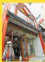
おなじみ派手なウエスタン・ブーツの外観。