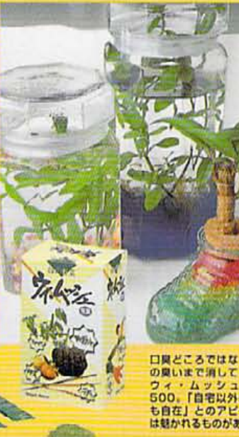
口臭どころではなく排便の臭いまで消してしまおう。ウイ・ムッシュ以外の排便も自在」とのアピールには驚かれるものがある。

臭や体臭などの悪臭や生活に蔓延る様々な雑菌への敏感さは過剰とも言える現代人。そのクリーン好きもここまで来たかと驚かされる新商品情報。まずは排便の匂いさ消すことというウイ・ムッシュ。8種類の天然野菜を特殊製法でブレンドした緑黄色野菜による健康食品のだが、飲用後一週間で天然活性酸素が口臭や排便、オナラなどといった悪臭を元から消臭。無臭体質にしていこう。もう一つがクリン。人気のアクリウムを手軽に作れるコスモサント。水質を浄化させる効果で3カ月は簡単に飼育出来る。 ■問い合わせ先 ウイ・ムッシュ 0422・20・3095 コスモサント 藤井大丸 075・701・4717