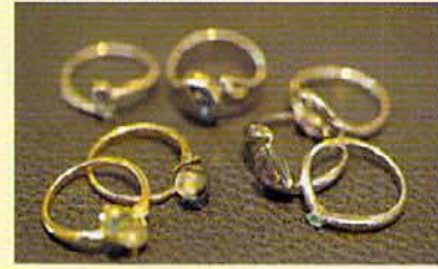
誕生石を使ったリングなども充実。値段はだいたい ¥20,000前後〜と無理なく買えるプライス設定。