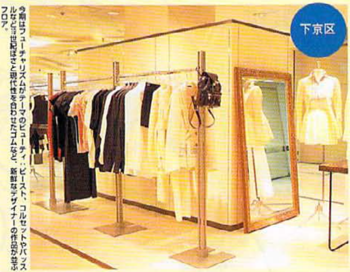
今期はフューチャリズムがテーマのビュティビリスト、コレセプトやパンスルなど近世紀はさと現代性を合わせたゴムなど、斬新なデザイナーの作品が並びフロア。