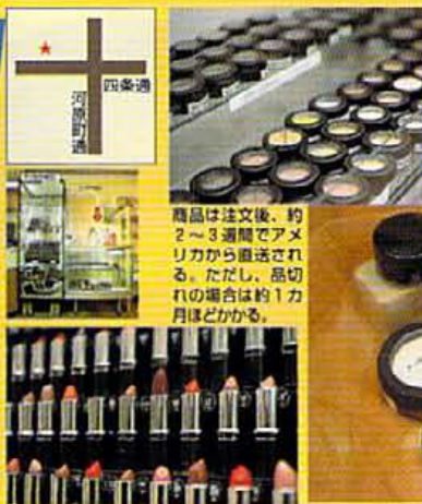
商品の注文後、約2〜3週間経てアメリカから直送される。ただし、高切りの場合は約1ヶ月ほどかかる。 表示価格は、すべて送料込みの値段、また、商品のテストティンギングは、手の甲でのみに限られる。