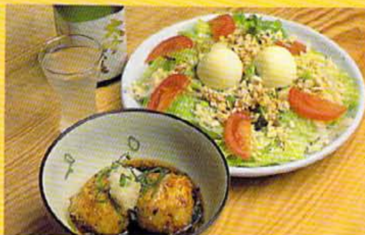
ハゲつゆをイメージした玉子2つに注目の揚げつゆサラダ¥800、揚げ出し豆腐 ¥350。ほか、本日のオススメなどもあり、日本酒¥400。