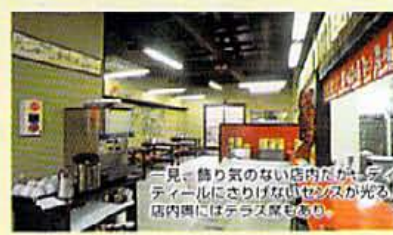
一見、飾り気のない店内だが、テーブルにさりげないセンスが光る。店内奥にはテラス席もあり。

店内のムードに合わせ、スタッフのユニフォームも大衆食堂チックで雰囲気盛り上げる。