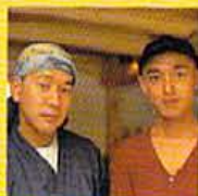
そう広くないスペースがアットホームなムードをつくる。知らぬ人同士でも友達になれるぞ。

を切り盛りするスタッフ二人はともにスキンヘッド。で、この名前。肝心の料理の方は、揚げ物、煮物などスタンダードなメニューが中心。とはいわば男の真心料理ともいえる逸品ぞろい。なにぶん、この4月にオープンしたばかりとあってまだまだ内容はチェンジしていくとのこと。また、ドリンク類もスタッフ自ら試飲して、太鼓判をおした日本酒などを、さりげなくこだわったアイテムが揃う。「お客さんと店が一体となった気さくな店づくり」を目指す男二人。これは期待せざるにはいられない。 ■京都市中京区木町六條下町一軒がビル内 075・256・2525 075・256・2525