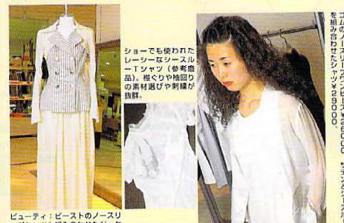
ショーでも使われたレーサーなスウェットシャツ(参考価格)。裾ぐりや袖ぐりの裏材選びや刺繍が抜群。