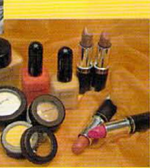
流行のベージュ系ピンクの口紅 ¥3,300。アイシャドウ小 ¥3,000。フェイスパウダー小 ¥3,800。

スーパーモデルをはじめ、日本でもコスメ好きの間ではすでにヒット中のコスメティックブランド・M.A.C.が、いよいよ京都にもお目見え。インフンの四条本店、その取り扱いを始めている。アイテムは、口紅からアイシャドウ、ファンデーション、ネイルとフルでラインアップ。USAもの強味、もともとカラーバリエーションの豊富さで人気のブランドゆえ、ここでも口紅なら134種類と充実。特に、今シーズン流行のヘーシニ系は、国内ブランドではだせないカラーも揃うので要チェック。また、ファンデーションもかなり濃いめのものがあるので、日焼けは、ぜひ。 ■京都取扱いインフン西陣本店 075・221・0884