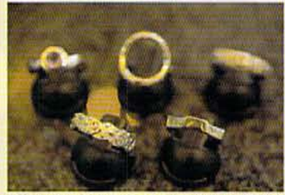
プラチナ・デザイン・オブ・ザ・イヤー' 95受賞作品も店舗に並ぶ。もちろん、素材はオリジナルのプラチナ。市販の約2倍の硬さとか。

オリテイの高い、かつセンスのいいジュエリーを扱うショップとしてファン多しの「俄」が、北山に新店舗をスタート。アイリングを持つという強味ゆえ、約半分がオリジナル。デザインも「素材感、簡素美を追求する」とだけあって、どれも嫌味にならない華やかさ。また、素材はゴールドとプラチナ半々の割合だが、やはり、注目したいのは、プラチナ。他店ではない、ハードプラチナを使ったオリジナル素材で、変形もしくコチラはぜひともオススメ。ただ、オシャレなものが揃っているというだけでなく、こだわりのあるオーナーが、ジュエリーについての正しい知識をレクチャーしてくれるのも他にはない魅力。 ■京都市北区上賀茂岩ヶ谷内町N・Prada 1F 075・724・3948 ●11:30AM〜8:30PM / 火休