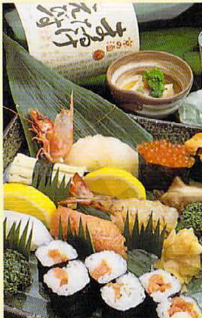
これだけ入って¥3,500は安い。「ネタは全部天然ももんや」 トロやいくらは当然のネタも実に良い。おすすめの日酒 まるたけえびは¥300。