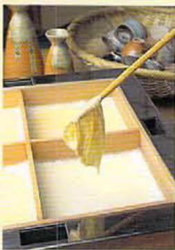
時間をかけて楽しめる自分で作れる引き上げ湯豆腐 ¥3,000。