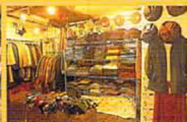
帽子もほとんどがオリジナルで揃う。店内はメンズとレディースが半々。常時約2000点がぎっしりである。