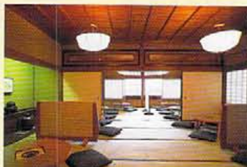
お座敷二間を使つての和める道り。