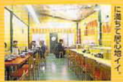
細くて小籠のルック スな皮と、中に入れば アツトホムな湯もり に浸して唇の地イイ