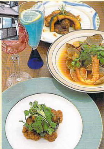
精茄子とフォアグラのステーキ¥1,500、地鍋のスパイス焼¥1,200など仏アレンジの料理は必食!

女性一人でもフワリと立ち寄れそうなカジュアルなダイニング「きりんや」が東山にお目見え。料理は、和洋折衷。和の素材を洋風にアレンジしたり、その日仕入れたばかりの新鮮な食材を使った日替わりメニューなどオリジナルに富んだメニューが約70種類と充実。また、シェフは全員がホテルのフランス料理出身ということも味わい本格派ながら、リーズナブルなフレンドlinessを兼ね備えている。ドリンクもビールをはじめ、日本酒からカクテルとフルでラインアップ。特にワインは HALF ボトルで¥1,500、グラスなら¥400とカジュアルなプライス設定。事前に予約すれば希望に近づいてコースも受け付けてくれるので、お試しを。 東山区東山区板橋八坂神社東山公園上北側、03-56-51-1220 11:30~1:30 5:30~11:30 入店予約 / 水・木・土・日・祭日 不定休