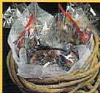
香水以外に最近ではドイツ直輸入のホプリも、季節によって香りは変わる。パッケージで¥1,000~。