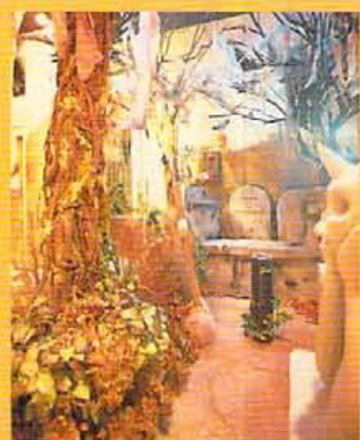
待合所には墓石をモチーフにした椅子が、なんとなく落ち着かないのは恐がりだからか。

■京都市中京区三条通河原町東入大黒町3-7 フォオン西木屋町4 〒075-2262 3161 12:00PM-15:00AM 無休 075-2262 3161 12:00PM-15:00AM 無休