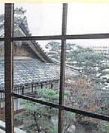
波打つて見える昔の手作りガラスも味わい深い。