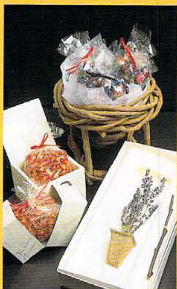
容器(500円~)はすべて適量かつけられるように作られている。他、アトマイザーも備わっていて、衣類に染みがつかないよう配慮。