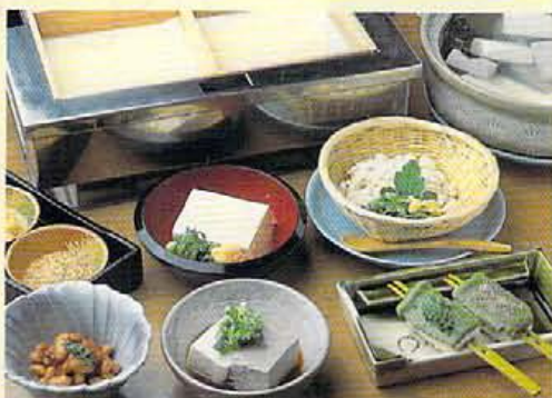
湯豆腐には丹後の黒豆で作られた黒豆豆腐もあり。型に入られる前のコクのあがる豆腐に、豆腐田楽などまさに豆腐づくしである。