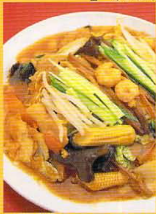
きくらげ、金針菜、筍、エビ、豚肉、きゅうりなど山盛り入った天津らう麺。これだけ入って¥680!

バス、阪急、嵐電のアク セスポイント。四條大宮 一ツツ原。人気ア ンバーの天津包子(内 心1個¥80)。 お客の注文を聞いてから 一つ一つ作る。人気ア ンバーの天津包子(内 心1個¥80)。 お客の注文を聞いてから 一つ一つ作る。人気ア ンバーの天津包子(内 心1個¥80)。