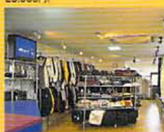
ボードはもちろんメーカー保証付。また、ボードをはじめウェアなどのレンタルもあり、5,000円~