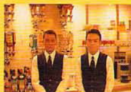
スタッフも本場のギャルソン・スタイル。写真では見えないがあの長いエプロンもちゃんとつけている。