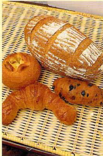
上から右回りにミッシュ・ブロート¥280、フルール・オ ・ショコラ¥90、クロワッサン・オ・プール¥150、パ ン・オ・ポムドテール¥150。どれも絶品。

■京都市中京区北白川上段町5 TEL:075-702-8080 ●日:09:00~17:00 月:09:00~16:00 火休