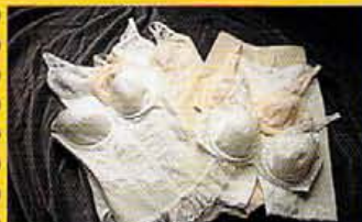
ボディスーツ28,000円、ガードル16,000 円、ブラ13,000円、商品は基本的にすべて セットで購入。

女性に人気のボディメイクファンデーションを扱う「ココ」が、さらに機能 性をアップした新商品を発売。ボディラインをキレイに保てるということ はもちろん、今度の商品は、肌の保湿にも効果的な海苔の肝臓エキス スクワランを合繊としては初めて、繊維に加工した快適保湿加工素材、パルス ティックを使用したもの。これにより、理想のプロポーションが保てる上お肌もス ベスベに。女性の頼もしい味方の誕生、これはぜひ、試 してみたい。