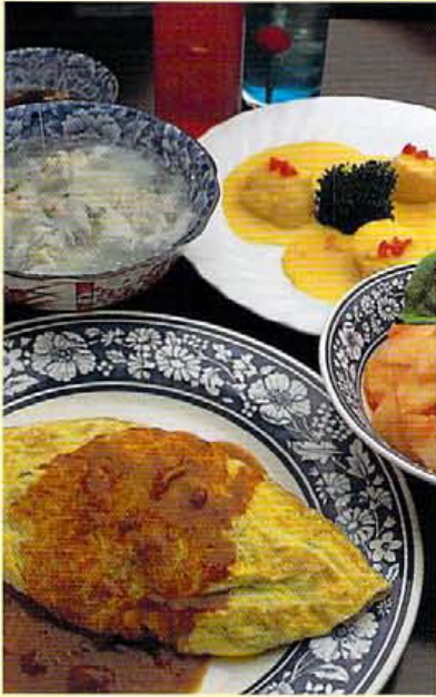
右上から帆立貝のソテーウニソース¥1,200、水ぎょうざ¥600、じゃがいもと明太子のサラダ¥600、オムライス¥700。見栄えに違わずお味もなかなか。

メリーアイランド ちよつと落ち着ける木屋町御池辺り。 様々な嗜好がリミックスされているから 使い勝手もなかなか。