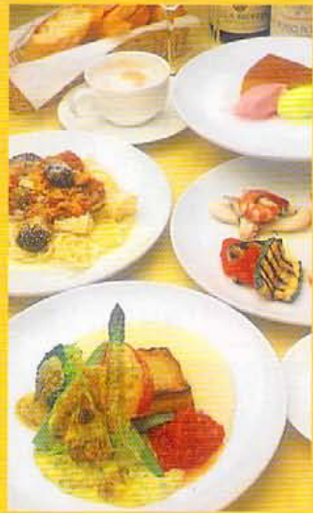
アミューズとしてこの日はスープ、前菜三品、ルオーチ（華輪のバスタ）の午後内入りきのごとマトソース、比目魚と温泉卵のグ ラタンクリームソース、デザートで¥3,500ナリの日コース。

大衆的イタリアが楽しめる人気だったストロロンツォのクロス跡が、ま たしてもイタリア料理を楽しめるスポット、チャオイタリアに生まれ 変わった。今度こちらで味わえるのは、前菜から始まってバスタ、 メインディッシュ、デザート、エスプレッソでしめるコース料理。といつも 構えたものでなく、¥2,500といった手頃な価格から楽しめる気軽な メニューで頼んでしまつたのがこちらかといえは得。魚は毎朝朝市で仕入れてくる 日替わりな上、好き嫌いなどもあらかじめ聞いて配慮してもらえ る。