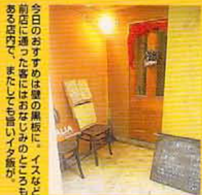
今日のおすすめは壁の黒板に、イタナ 前店に通った客にはおなじみの「 ある店内で、またしても面白いイタ飯が、