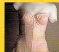
ショーツ4,500円、スリーヴン 40,000円、着用し続ければ、早 いな510日で効果があるとか。

■京都市北区上賀茂岩倉町10-1075・075-0702・49889 ●10:00~18:00 月:09:00~17:00 火休 ●予約制