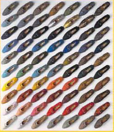
透気性、吸湿性、吸汗性、抗菌防臭にも優れ、色落ちの心配もなく汚れにも強い。あなたほどの色を選ぶ。

さらさらながらとはいえビットモカシンである。そのカラーリングの豊富さで、この冬一際注目を集めているのが、バスルームの「カラー・ヴァリエーション70」。実に70色もパターンが揃うというこのシューズは、すべて合皮で¥6,900〜という素材やプライスよりは、「ヴァリエーション豊富でとことん自分好みの一足に合える」という辺りがヴァリエーションアイテムといえるであろう。カラーのヴァリエーションにこだわったものも珍しく、つくづくパーソナルな時代になったと実感させられる。