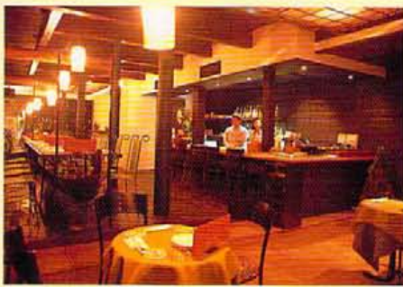
大テーブルの下はインドで使われていたというカヌー。天井上を飾るのは蕨根、柱は古い電燈柱をペインティングしたもの。