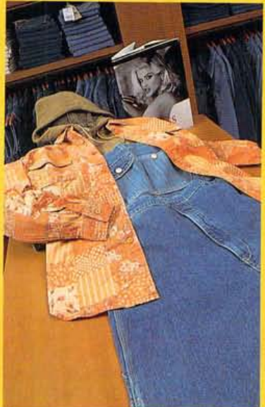
マザー・コットンのオーバーオール ¥19,900、プラス ¥12,900、パーカー ¥10,900 でアメリカン・カンントリー。

ついに日本でもライセンス契約が決まったケス。さっそく5軒が全国同時オープンとなったのだがその一軒が北山にも。意外だが全国でもここが初の路面店となるだけに、店内には日本でも手に入る商品がフルラインナップ。ケスファンとしては待ちわびた貴重な一軒となりそうだがこの冬おすめはベージュシックでさっそくりとしたニットや洗う程アンティークな風合いが楽しめるマザー・コットンのジーンズなど。バッグ、ステイショナリー、シューズ、時計などといったアイテムも充実。今後はメンズラインも豊富に揃うとのこと期待。 ■京都市北区北山通り貞利ビル1F 075・724・9800 ●11:00開店/0:00閉店/無休