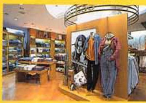
右人気のリアルタイム ¥12,000、他 ¥7,000 と価格もお手頃。