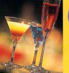
カクテル、ボトルは全部で約40種類、ショット800円〜、キール6,500円〜、カクテルはオール1,000円。