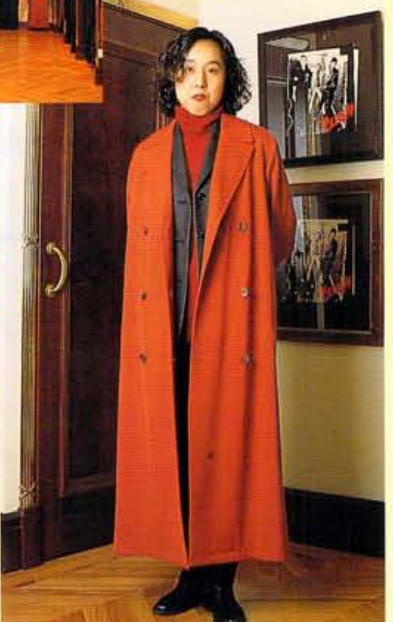
赤にオレンジを重ねる新鮮なコーディネート。ニット¥18,000、パンツ¥19,000、フラノジャケット¥49,000、カルセコート¥79,000。

この秋冬のテーマは“Poet With A Few Bobs”。お金に余裕のないアーティストックな人、の意味で普段はしないような組合せが思いがけない効果を生むような、アーティストックでクリエイティブな装いのこと。