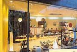
器はご飯茶わんで2,000円〜、お鉢1,800円〜と買い求めやすい値段設定。プレゼントなどにもピッタリ。