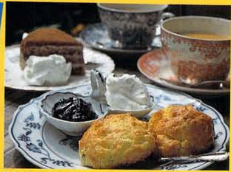
毎日焼き上げるスコーン(2個¥450)、左チョコレートケーキ(¥450)、ロイヤルミルクティー(¥500)。

FASHION GOODS GOURMET SPACE SHOP NIGHT SPOT