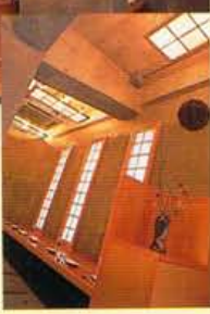
予算は平均3,500円位。ドリンク類も充実し、ここではやっぱりカクテルやバーボンと一緒に楽しみたい。

高価な料理とつばい通りの外観。店のデザインはすべてインテリアデザイナーでもある店長によるもの。