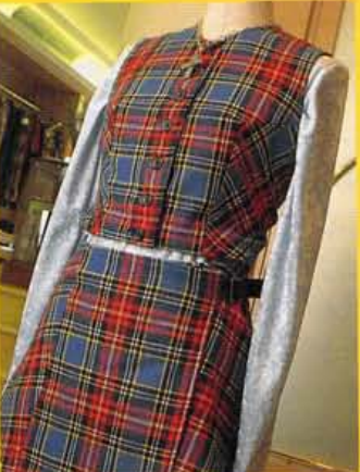
ウェア以外にピアス(300円〜)などのアクセサリも充実。写真シャツ5,900円、ワンピース19,800円。

流 行のファッションに挑戦したいけど、あとあとのことを考えるとなかなか手がでないというのが女性の本音。そこで紹介したいのが、チャックチャケット・キット。遊び着的なウェアをメインに時代のツボを押さえたアイテムを着る機会と値段を見合わせやすいカジュアルなプライスで提供してくれる。オリジナルをはじめフランスからのインポートものなど、今的なアイテムやアクセサリなど、お洒落心をくすぐられずにはられない品揃えが魅力。本拠地、東京では大人気のお店、お洒落な京都ビールの間でもブレイクすること間違いナシだ。 ■京都市中京区御幸町通錦糸町下ル北山町1-1 075・200・1519 ●10:00開店/0:00閉店/無休