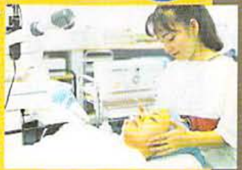
ウツティな雰囲気あふれる店内は、女性ならではの親しみとコーヒーの香りあふれる空間。

ボ ディのトナフルから精神的な悩みまでケアしてくれる女性の救世主・ピセール ノーマ・ジーンが店舗を拡大してよりパワーアップ。「美しさはその人の胸の奥に落ちる女性的な救世主」というコンセプト通り、平均1時間のマンツーマン・カウセリングが好評を得て、3Fだけではまかなえなくなったのがその理由とか。ゆったりとした空間で心も体も美しくなる。これからも頼もしい女性の味方となりそうなお気配だ。 ■京都市下京区河原町西入丸京橋店内 TEL:075・344・2888 10:30開〜17:00閉(木) 月の期間休(水)