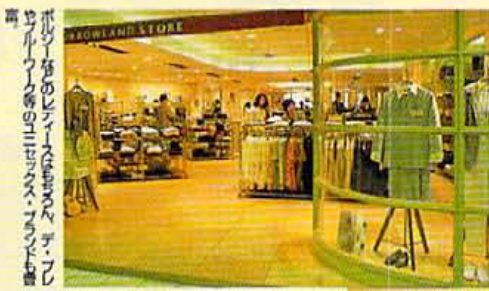
ボリー発のレイスもまた、デニールウール等のユニセックスのトレンド