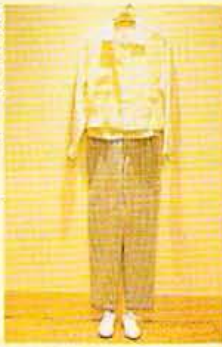
麻のシャツ ¥19,800、インナー ¥7,800、パンツ ¥13,800、靴 ¥7,900。