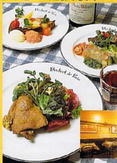
写真は鴨肉のコンフィーカリ焼き、牛タンとゼリー香辛(ペリ)風味、デザート盛り合わせ。

■京都府中京区新町通西条上ル一筋目東入ル 075・2522・1825 11:30AM~2:00PM 5:30PM~9:30PM/日休