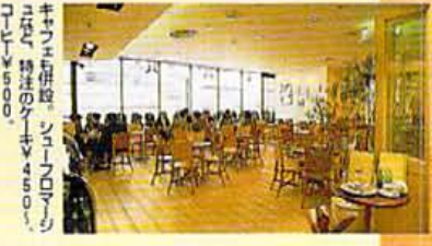
キウイと併設、レビューブログにもよく特注の ¥4500、 ¥7500。

ナチュラルな風合いのステーションナリーもおすすめ。素朴な直りの ¥EV 300。