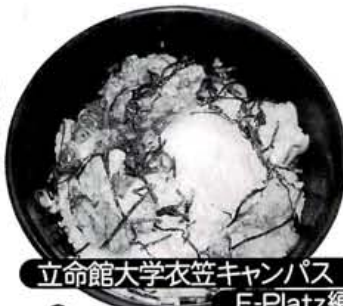
立命館大学衣笠キャンパス E-Platz編

とりまヨの秘密はマヨにあり。醤油、ごま油、七味を絶妙ミックスし分量は食堂のオパチャンの勘で妙味をキープする「とりまヨ井」380円。「手作り杏仁豆腐」180円は試行錯誤の末、今のやわらか食感に辿りついた逸品