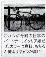
こいつが今回の仕事のパートナー。イタリア娘だぜ。カラーは真紅。もちろん俺よりギヤが高いわ。

いやあ〜ほんといい旅でした。色んな人の「愛」を感じる事ができて。そして自転車はとて前向きな乗り物だと思っただ。進むにも戻るにもペダル踏まないといけないんだ。俺も今回の旅みたい人生ペダル踏んで行ったりしますわあ。