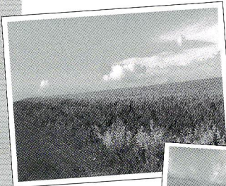
こんな風景がズット続くんだわ。距離感狂うねえ〜