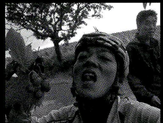
ほらね。きれいに磨いて桐箱に詰めれば万円の味でした。この経験はプライスレス間違いなし!

ずばり雨宿り。もう凄かったです。走る前方に明らかにどす黒い雲から灰色の斜線が見える。雷鳴も聞こえるし、稲光もくっきりハッキリ。スタッフは正直でいいねえ。『雷落ちたら大変です、雨宿りしてください』って言うてくれればよかったら、俺はまだまだ頑張れるぞってアピールせな思っって『まだ体