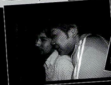
要らん事、考えるキンちゃんとかクミちゃん。(アニメオタク仲間)