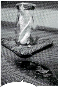
この節、木目。いいんじゃないかね〜