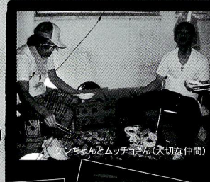
ちよん・ムッチヨさん(大切な仲間)

はいはい延期ですか? キャンセルですか? 何やてえ〜! 中京、下京に住んでる役者は来んといてくれやと!?