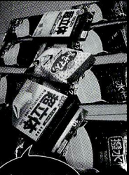
冬になったら、色とりどりに染めちゃうかな。

インフルエンザの話です。5月の末から6月にかけて修学旅行の生徒さんに、狂言を見てもらうお仕事も結構あるんですよ。それがどうですか? 俺が行く予定だった修学旅行関係のお仕事、何と全部キャンセルになっちゃったあ。お陰で5月末、足袋履いたのたつた1回。ただ京都から地方の学校にも行くこともあるんやけど、京都に感染者が確認されたら、中京、下京に住んでる役者は来んといてくれ〜と事務所連絡があったらしい。なんかよー分からんなあ。だから梅雨前にBQなんかやっちゃった。しかしどないしてくれるねん、会ったこのマスク!