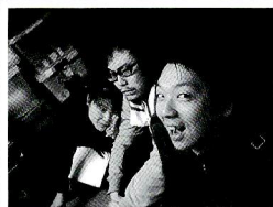
ぶっちゃけ稽古場は…たのすうい〜い！ 出演を待つ仲間たち。