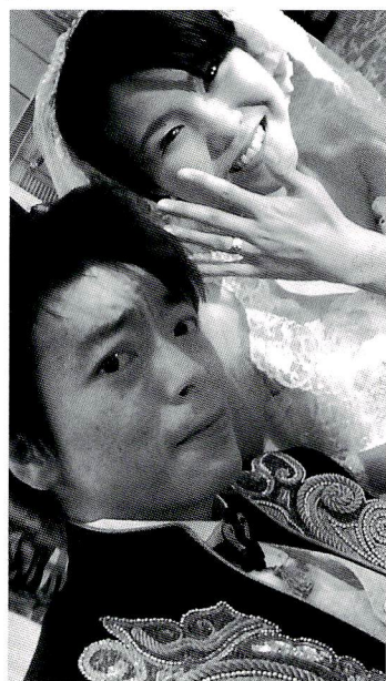
これが公国祭のメインの二人だ。まっ、見たくないかな？

はい、去年入籍して約1年。オフィシャル的には披露宴もなく、ただらしてののもいかに。かと言って今更、披露宴もどうかと。そう、だー感謝祭みたいなパーティをしよう。つな事、やっちゃたんですねえ。普通じゃない事が大好きな俺。感謝祭にもかわらず、なぜかジョン公国祭。何処ですかその国？何ですかその公国？はい、アニメ「機動戦士ガンダム」に出てくる「赤い彗星」と呼ばれるエースパイロットが所属してる国です。宴会会場にはその公国の国旗が高々と飾られ、テーブルクロスもナフキンも赤。士官学校時代？の同級生や、戦場？での仲間達も、どこかに赤ものを身にまとい、会場全体はまさに真っ赤。自分自身の感謝祭？公国祭？どっちでもよかったです。来てく