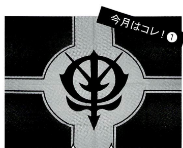
見よ！勇ましき公国の国旗