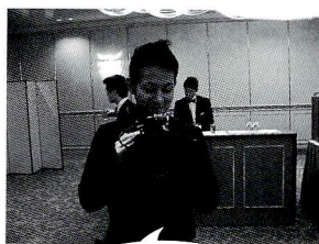
もしかしてドキュメンタリーで流れるかもねえ？

れる人が、いっぱい酒飲んで、飯食って、笑ってくれば。ドラゴンクエストのオープニング曲で入場して、嫁の開催宣言で、嫁が号泣。生い立ち映像を流し、互いの両親が号泣。ケーキカットしてお直しの為に俺と嫁は退場。その後、俺は両親と一緒に「雲戦士」で再登場。嫁は敵か「結婚行進曲」で再登場。そして「人前式」。神父さん、当然ニセモノ。だけどニセモノらしく最高の事言ってくれるわけ。「貴方は神の誓いを守れなかった。ダメな男です。さらに嫁にも「こんな男と永遠の愛を誓いたいですか？」嫁の答えは「頑張ります。おい！誓えんのかよ！来てくれたお客さんの盛大な拍手で何とか、夫婦成立。その後シークレットが飛び出す。