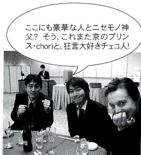
ここにも豪華な人とニセモノ/神父？そう、これまた京のプリンス・choriと、狂言大好きチェコ!

嫁に内緒にしてた結婚指輪をプレゼント。どうかのブランドとかダイヤいっばいとかじゃない指輪。【七つ割り立て四ツ目】俺ん家の家紋がガツッ入った指輪。もう逃げられなくしてあげました(笑)。暫し歓談の後、メインイベント「両親への手紙」。俺も書きましたよ、家族に。しかし嫁は両親ではなしに俺に。泣きました。スーッと泣いてました。プロポーズの時から、その当日の事まで色々メッセージまでもらって、とにかく自分達で、勝手に感動してました。ずつと勝手に楽しんで、勝手に泣いてたのに、何故か来てくれた人も楽しく、号泣してもうたみたいで。たぶん俺ら夫婦が嘘つかないかつた事と、常識を無視したパーティさしてもらったからでしょうね。来てくれた全ての人に「愛すべき全ての人間に。支えてくれる全ての人に…応援してくれる全ての人に…。読者の全ての人に…」。そして全その人の勝利の為に…。ジーク・ジョーン!!