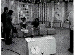
添田アナウンサー、かなり助けてもらってます