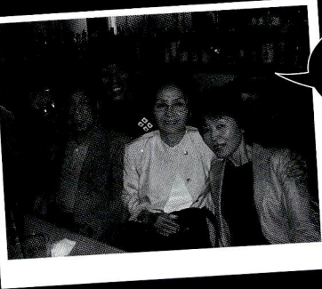
見て見て、俺の祖父ちゃん! 雑誌に出まっせ言うたら、「おっ、かまへんで」やて。さすが器がちゃいます