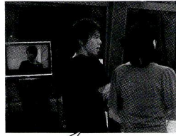
あっこれ私服です

見て見て、久しぶり集まった4兄弟、ちっちゃいけど許してえ〜。記者会見をスタッフにカメラ預けて撮ってもらったから。7月25日の「ちりとてちん外伝・まいご3兄弟」観てねえ〜!!!