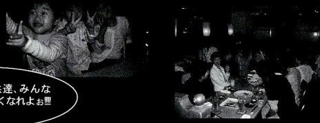
従弟の子供達、みんな元気に大きくなれよ!!!

休みじゃないけど、仕事の後で茂山家全員集合、ちよいとめでたい宴会がありました。ごちゃごちゃのムチャクチャです。誰が何喋ってるか、全然関係なく盛り上がりつつある様子です。