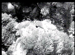
インド洋固有種 モルディブアネモネフィッシュ