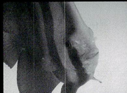
ツバメウオ。寄ってきたのでアップです