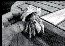
デカッ!!! ヤシガ二ちゃんよ、ヤドカリです