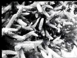
ミスジリュウキュウスズメダイ

自然と共存・環境保護とか言うのは簡単なんやけ ど何が出来るといわれると…ねえ〜? 来年もお土産は、燃えないゴミです。