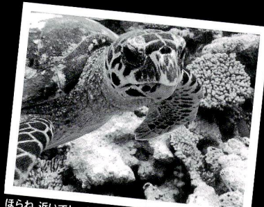
ほらね、近いでしょ逃げへんねんもん。タイマイって海亀