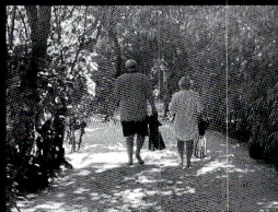
こんな夫婦になれればなあ〜と思いつつ

面(おもて)じゃなく マスク被り、足袋じゃ なくフィンを履いて、 海へとお仕事に。