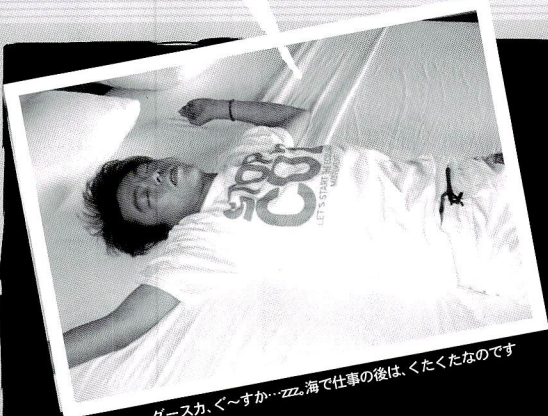
ゲースカ、く〜すか…ZZZ。海で仕事の後は、くたくたなので