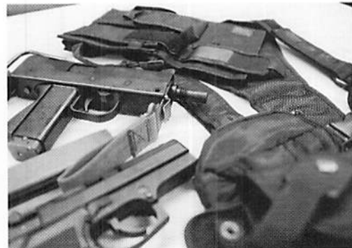
「押収品」のイメージ。全て私物。銃砲店に立ち寄る機会が増。個人的には電動ガンより、リコッキング・コイル(撃ったときの反動)がリアルなガス・ブローバックタイプが好きです

THE ROCK (サ・ロック) ☎0774-62-9933 http://www.blue-jp.com/therock/