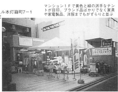
マンション1Fで黄色と緑の派手なデントが目印。ブランド品ばかりでなく家具や家電製品、洋服までもがずらりと並び