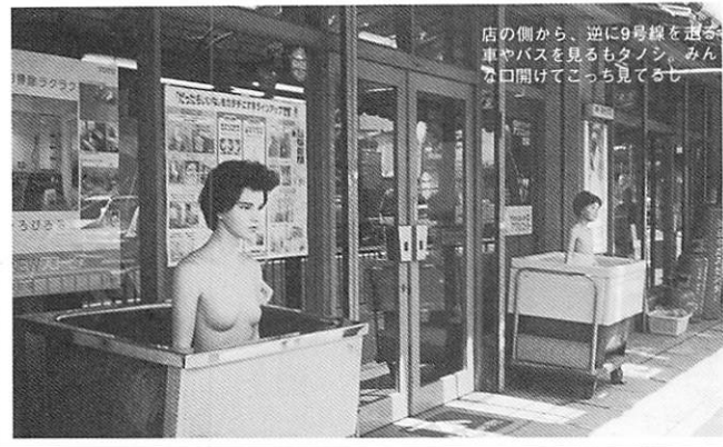
店の側から、逆に9号線を通る車やバスを見るもタンク、みんな口開けてこっち見てるぞ

タクシーに乗って西京区のとある住所を告げたら、運ちゃんいわく「ああ、マネキンとこの近くやな」。なんのこっちゃ?と思ながらも、そろそろ着かな...と窓の外を見ていると、目を疑う意外な光景にアゴもはずれるかと思いましたが、ハイ。9号線の往来で、素っ裸の美形母子がドアの両脇でご入浴中。訊けばこの店、「マネキンのガス屋さん」としてこの界隈ではちょっと知られた存在。浴槽のディスプレイとしてマネキンフリークのご主人が25年前に始めて以来、なんと月イチでマネキンも浴槽もチェンジする疑りよう。しかしこれ、裸マネキンのインパクトが強すぎて風呂桶すっかりカスんでるんですけど...。京都ピクナーは必見、ドライバーの皆さんは見とれてつついとおカマ掘り、てなことにならぬようご注意ください。